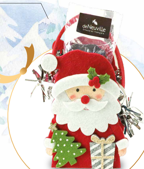
29. Sac feutrine Père Noël

Garni d'un sachet de petits sujets en chocolat, de papillotes et de boules en chocolat