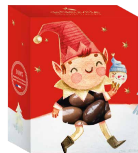
27. Étui petit lutin