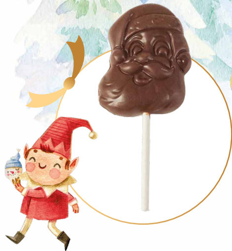
24. Sucette Père Noël en chocolat au lait

Noël c'est aussi et surtout une fête pour les plus jeunes et le Père Noël semble avoir bien compris que le palais des tout-petits est aussi très exigeant... Alors craquez pour notre offre de gourmandises pour les petits et les grands enfants !