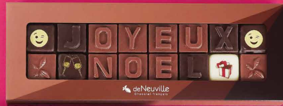
11. Message « Joyeux Noël »

Ce message à croquer est le cadeau idéal pour les comités d'entreprise ou vos cadeaux d'affaires.