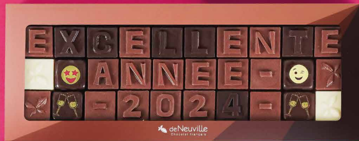
12. Message « Excellente année 2024 »