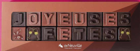
13. Message « Joyeuses Fêtes »