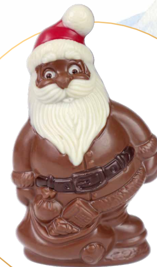
28. Père Noël et sa hotte en chocolat au lait

Garni de billes de céréales soufflées enrobées de chocolat lait et noir