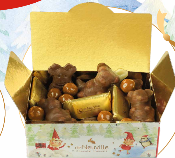
25. Ballotin de Noël

Ballotin garni de petits sujets de Noël, de petits ours en guimauve, de gianduja et de billes de céréales croustillantes au chocolat blond