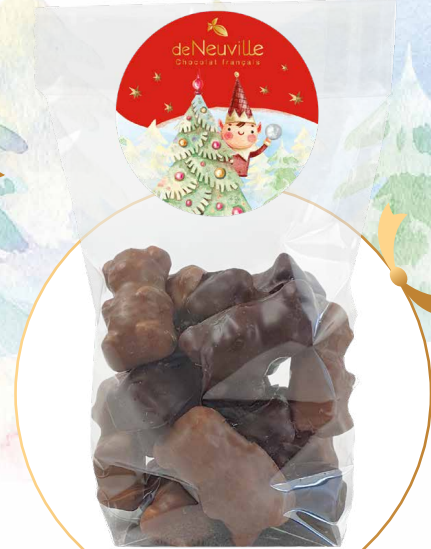
26. Sachet de petits ours en guimauve

Ballotin garni de petits sujets de Noël, de petits ours en guimauve, de gianduja et de billes de céréales croustillantes au chocolat blond