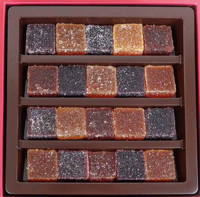
22. Coffret 20 pâtes de fruits